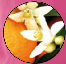
FLORI DE PORTOCAL | FM218

PARFUM 50 ml (concentrația de parfum 20%)