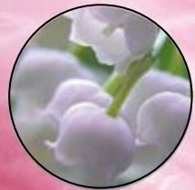
FM213 | LĂCRĂMIOARĂ