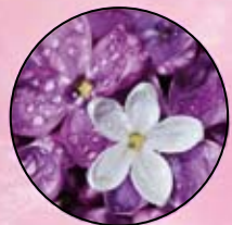
FM211 | LILIAC