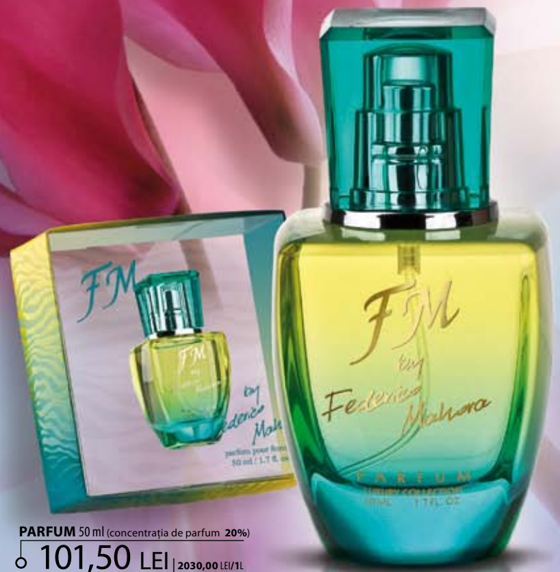
PARFUM 50 ml (concentrația de parfüm 20%) 101,50 LEI | 2030,00 LEI/1L

FM 305 | Fermecătoare aromă, în care se împletesc ușor notele bergamotei, rubarbei, trandafirului, de patchouli și tuberoză