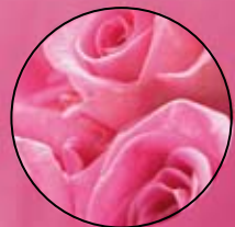
TRANDAFIR | FM217