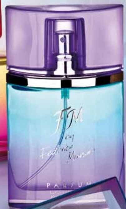
PARFUM 30 ml (concentrația de parfüm 20%) 101,50 LEI | 3383,33 LEI/1L

FM 306 | Sofisticata combinație a tentantei arome de pară, iasomie, patchouli și a Styrax japonicum-ului cu condimente picante: ghimbir și șofran.