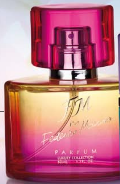
PARFUM 50 ml (concentrația de parfüm 20%) 101,50 LEI | 2030,00 LEI/1L

FM 305 | Fermecătoare aromă, în care se împletesc ușor notele bergamotei, rubarbei, trandafirului, de patchouli și tuberoză